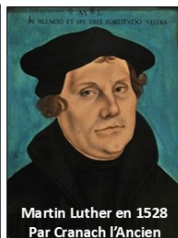
Martin Luther en 1528 Par Cranach l'Ancien

Luther est dénoncé à Rome par l'archevêque Albrecht. Le pape Léon X lui ordonne de se rétracter par la bulle pontificale Exsurge Domine , mais Luther la brûle en public le 10 décembre 1520 et rompt définitivement avec l'Église catholique, le 3 janvier 1521, quand il est excommunié. Ce sera donc la Réforme. Luther est caché par Frédéric le Sage un an au château de Wartburg.