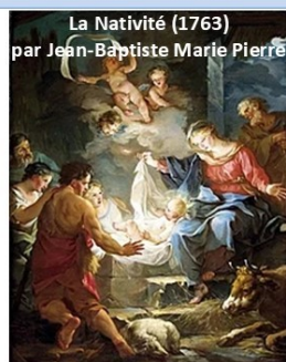
Christmas viendrait du vieil anglais : «cristes mæsse»

Noël est la fête chrétienne qui célèbre la naissance de Jésus de Nazareth au moment du solstice d'hiver. Pour un grand nombre de personnes, Noël est une fête populaire déconnectée de son fondement religieux. Instituée le 25 décembre au IV e siècle (336) et diffusée par la christianisation progressive de l'Europe et du bassin méditerranéen, cette fête de la Nativité remplace peu à peu Dies Natalis Solis Invicti , « jour de la naissance du soleil vaincu » fixée au 25 décembre par l'empereur romain Aurélien en 274, au lendemain des Saturnales romaines et de la fête de Mithra en Perse, divinité solaire, liées au solstice d'hiver. Le Christ étant présenté comme le « soleil de justice » d'une nouvelle ère, sa naissance ouvre l'année liturgique chrétienne lors d'une messe de minuit ritualisée.