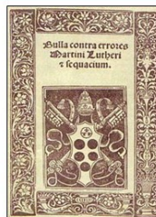
Bulla contra errores Martini Lutheri et sequacium