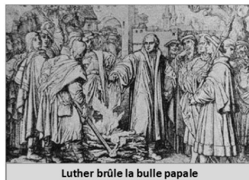
Luther brûle la bulle papale