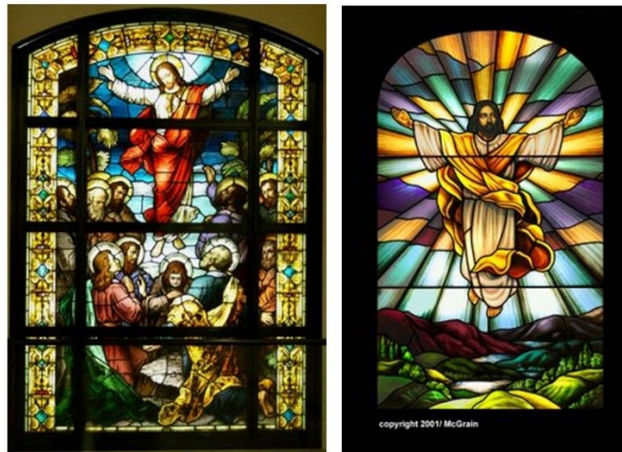
Cathédrale Notre-Dame-des-Anges (Los Angeles) et vitrail moderne

Texte de Sœur Myriam, ancienne Prieure des Diaconesses de Reully.