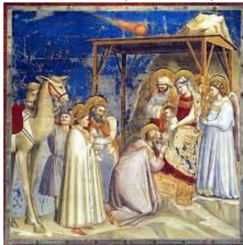
Adoration des mages (Giotto 1305 Padoue)

Qu'importe la date et le signe vu par les astrologues ; cela reste un mystère et le croyant avec sa foi n'a pas besoin d'une démonstration scientifique. Mais nous pouvons cependant nous émerveiller du monde qui nous entoure, le monde lointain du cosmos mais aussi le monde à notre portée, celui que nous voyons avec nos yeux humains, la nature avec les plantes et les animaux, et aussi le monde minuscule que nous commençons à appréhender avec les microscopes, ce monde de l'infiniment petit et qui pourtant nous constitue par ses atomes. A titre personnel, je m'émerveille aussi du génie humain qui permet de créer des instruments incroyables comme le télescope James-Webb ou les accélérateurs de particules. Rendons grâce à Dieu qui nous a dotés d'intelligence et essayons de la mettre au profit de la création en ce 21 ème siècle, pour « nous mettre en transition » comme le propose le titre du dossier de Paroles Protestantes de Janvier 2023.