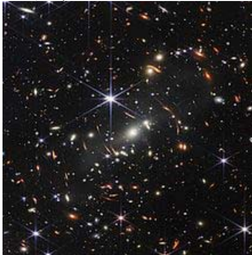
Image du télescope James-Webb juillet 2022

ont suivi l'un de ces astres brillants qui les a conduits à Jésus. Pour moi, l'étoile qui scintille dans cette photo est comme le symbole de celle que les astrologues ont pu suivre pour rechercher Jésus. Pour moi aussi, ce que nous révèle la science du 21 ème siècle est en accord avec la toute-puissance de Dieu et je m'émerveille toujours quand je regarde un ciel étoilé, la nuit, de notre petitesse et de l'infini qui nous entoure. Nous ne savons pas quel astre, planète, comète ou autre phénomène astronomique, a pu réellement exister au moment de la naissance de Jésus dont l'année de naissance reste incertaine, il existe de nombreuses hypothèses comme l'alignement de Jupiter et de Saturne en 7 avant JC ou la conjonction de Jupiter et de Vénus en 2 avant JC, par exemple. Nous ne savons pas non plus exactement quand les mages sont arrivés à Jérusalem pour interroger Hérode (Matthieu 2, 1-3) mais il décidera de faire tuer tous les enfants de moins de 2 ans (Matthieu 2, 16).