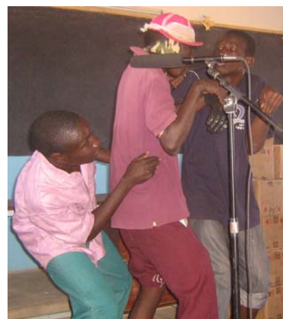
Détente et théâtre