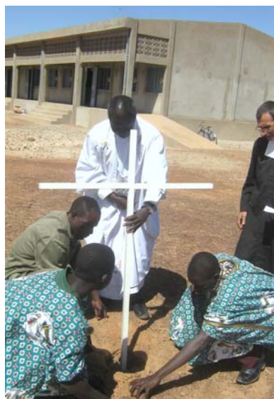
Prière et bénédiction