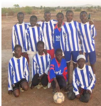
Jeux et sport

Pour plus de sécurité, si vous versez quelque chose, veuillez par courrier électronique nous préciser comment, quand, combien.