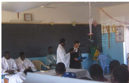
Accueil et allocutions

Prochaine étape : la construction des bâtiments communautaires pour le logement des Frères, au sommet de la colline, avec un panorama fantastique, et loin des bruits des bars tonitrueux de la ville... Avec votre aide, vos prières, votre fidélité.