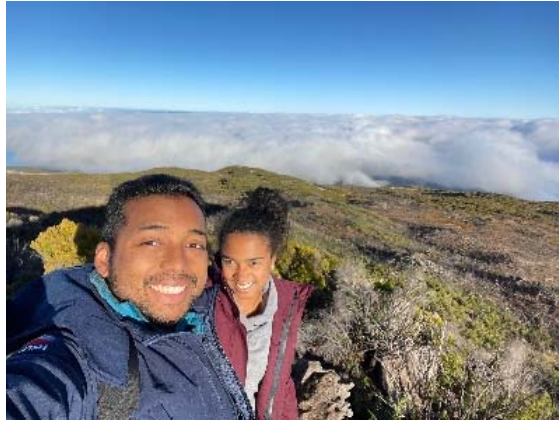
Randonnée au Maïdo