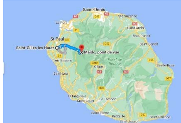
Plan de l'île de la Réunion