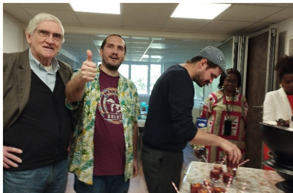
Photos du repas CASP d'avril 2025

Cadeaux de Noël pour les enfants suivis par le CASP. Plus de 1 000 enfants ont reçu un cadeau pour Noël en 2024 grâce à la générosité des paroisses de l'EPUDF. Vous pouvez aussi apporter un peu de bonheur à un enfant ou adolescent en mettant dans le panier au pied de l'autel le cadeau de votre choix (non emballé) à l'église jusqu'au 23 novembre. Attention : pas de jouets à pile, de maquillage, de puzzle, de CD ou d'électronique. La collecte sera apportée au CASP à Paris. Si vous ne pouvez pas acheter ou apporter un cadeau, vous pouvez faire un don à AESMMA en précisant cadeau de Noël et notre association achètera un cadeau de votre part.