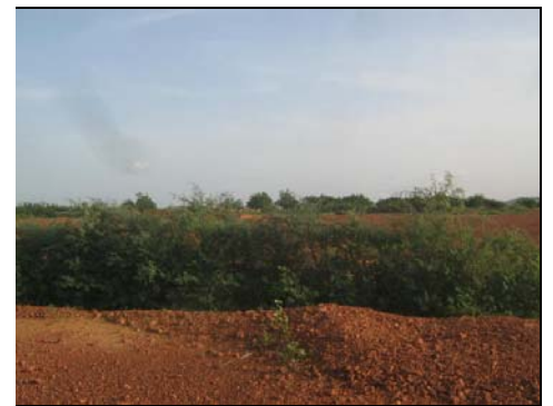
Haies en croissance !

L'équipement pour l'énergie solaire, souhaitable, semble moins urgent. Il n'est pas impossible en effet que l'électricité de la société nationale connexion serait alors possible (le devis La ville est alimentée en courant par une coupures sont fréquentes, mais le dressés depuis quelques mois (hélas en rares arbres de la région...) et des fils séparent de Ouagadougou: Kongoussi capitale, la connexion est effective sera là pour une cérémonie officielle le ligne est prolongée jusqu'à la ville collège pourront bénéficier de prix abordable, Dieu aidant.