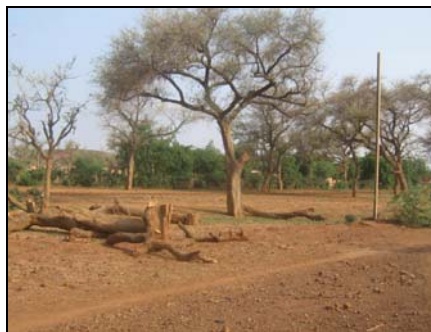
arbres sacrifiés pour le passage des fils électriques

L'équipement pour l'énergie solaire, souhaitable, semble moins urgent. Il n'est pas impossible en effet que l'électricité de la société nationale connexion serait alors possible (le devis La ville est alimentée en courant par une coupures sont fréquentes, mais le dressés depuis quelques mois (hélas en rares arbres de la région...) et des fils séparent de Ouagadougou: Kongoussi capitale, la connexion est effective sera là pour une cérémonie officielle le ligne est prolongée jusqu'à la ville collège pourront bénéficier de prix abordable, Dieu aidant.