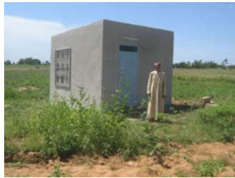
Le local du groupe électrogène

(Le véhicule Trafic...et, entre les deux, le point blanc : le toit du collège au loin)