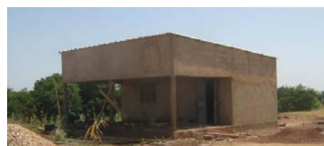
Vraie cuisine, en finition...à gauche cuisinière et marmite

La cantinière a perdu sa grande sœur, morte en couches. La cantine ne reprend que ce 3 octobre. Mais il y aura bientôt une vraie cuisine : auvent cimenté avec foyer amélioré et deux salles, dont l'une servira de magasin pour le collège. Il ne reste que l'enduit et le crépissage à faire. Le local du groupe électrogène –qui fonctionne au moins pour les heures d'informatique ! – a reçu grillage et protection, un beau crépi clair...il sera par la suite entouré d'arbres. Les Frères font toujours leurs six kilomètres pour joindre leur lieu de résidence au collège (24 km de chemins ravinés si on fait deux aller et retour, matin et soir)...mais ce n'est pas seulement à mobylette : la camionnette Trafic ne va pas à