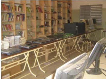
C'est encore la bibliothèque, en attendant, et c'est la « salle d'informatique », avec 26 postes, disparates mais fonctionnels

musique... et de monter une clique ! Aux premiers désordres lors des troubles du printemps passé, le personnel s'est replié pour fuir jusqu'au soleil levant ! L'urgence, le chantier qu'il nous faut financer et ouvrir le plus tôt possible, c'est celui de la bibliothèque. La petite salle qui en tenait lieu sert maintenant de salle d'informatique. Il y a bien des rayons et