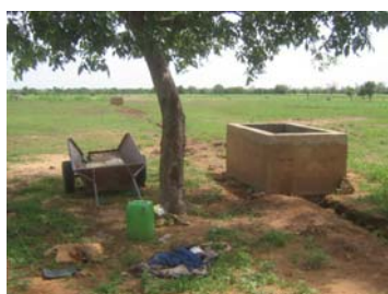
Bassins pour le maraîchage

Les nouveautés pour les élèves, outre la tenue, c'est la disparition des corvées d'eau, à près d'un kilomètre : le château d'eau est rempli, l'adduction branchée, les robinets sont devant les classes ! C'est aussi l'informatique, qui suscite un très vif enthousiasme. Toutes les classes y ont droit, inclus dans l'emploi du temps. Il y a un poste pour deux élèves. Malgré les dépenses supplémentaires, nous n'avons pas voulu imposer des frais supplémentaires aux parents.