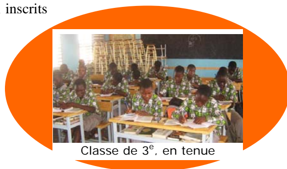
Classe de 3 e , en tenue

Et comme ils sont beaux ! L'uniforme réclamé depuis des années a enfin été adopté. C'est de l'argent immobilisé, certes, et c'est sensible quand les ressources sont limitées. Mais c'est sans regret...et même avec fierté ! L'équipe des professeurs aussi est constituée avec cette grande chance et réussite : aucun n'est vacataire, venant d'un autre établissement pour chercher quelques heures supplémentaires. Tous sont d'abord professeurs du collège, et cela permet de construire une bonne équipe, unie. C'est une grande joie de voir la richesse des partages lors d'une récollection commune (1 er et 2 octobre), catholiques, catéchumène, protestant, musulmans ensemble autour de saint Jean-Baptiste de La Salle pédagogue et témoin d'un Dieu éducateur.