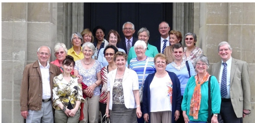
Visite de la paroisse Saint-Marc à la paroisse du Petit Saconnex (Genève) 14 juin 2015

Thomas A Kempis, Imitation de Jésus-Christ .