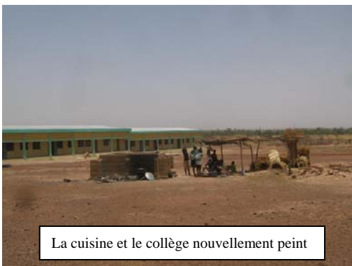
La cuisine et le collège nouvellement peint

La peinture. Les congés ayant été avancés du fait des troubles, nous avons aussi précipité les travaux pour achever le collège. Par souci de qualité et d'esthétique, nous avons préféré la peinture (Marmorex) au crépissage. Grâce à des dons cumulés nous avons réuni les 3 300 000 (5 000 euros) pour peindre le bâtiment. Jaune et vert : comme le blason du collège et comme le bâtiment de communauté. Nous avons attendu seize mois, mais il fallait que ce soit fait avant la fin de l'année : les élèves sont heureux et fiers. Le collège faisait