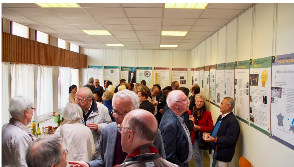
Moment de convivialité devant l'expo sur Luther