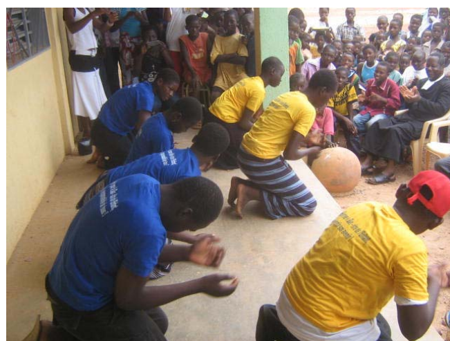
Danse, le 15 mai

Pour plus de sécurité, si vous versez quelque chose, veuillez, par courrier électronique frpbai@yahoo.fr , nous préciser comment, quand, combien.