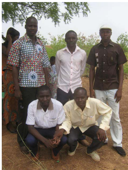
Groupe de professeurs

On décharge en même temps des briques pour le mur de soutènement et une benne de terre pour le jardin