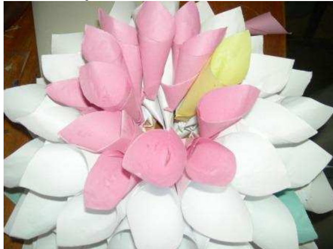
Fleur de papier pour décorer les classes