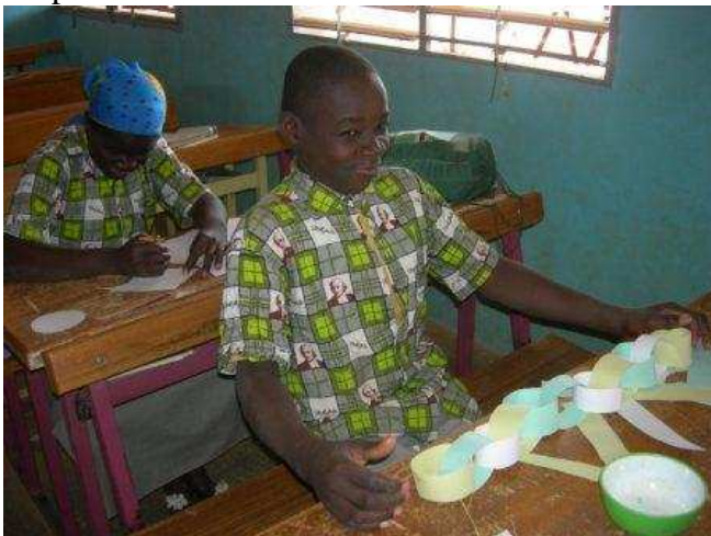
Joie de décorer la classe, de préparer la fête