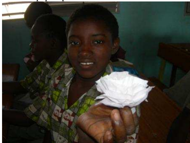
Je vous l'offre !

Pour plus de sécurité, si vous versez quelque chose, veuillez, par courrier électronique frphbai@yahoo.fr , nous préciser comment, quand, combien.