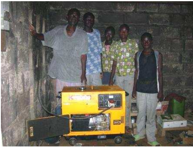
Le nouveau moteur