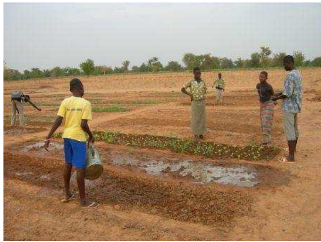
Planches au jardin