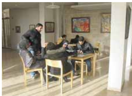
Cafétéria et exposition