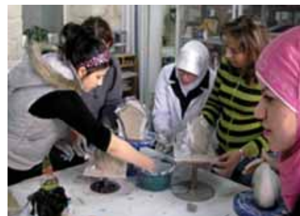
▲ Cours de poterie, verre et céramique