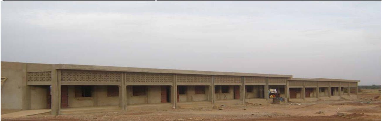
Collège Lasallien de Kongoussi