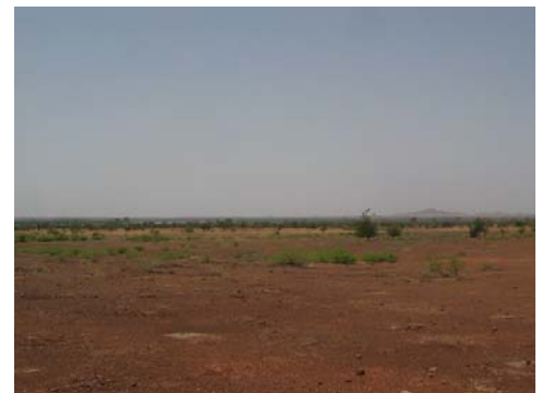
Terrain du collège à Loulouka On aperçoit le lac de Bam au fond

Pour plus de sécurité, si vous versez quelque chose, veuillez par courrier électronique nous préciser comment, quand, combien.