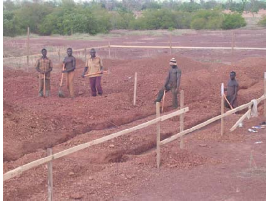
Chantier pour le collège de Loulouka 15 juin 2009

Enfin ! Cette photo pour attester que les travaux ont enfin commencé à Loulouka , depuis le début du mois de juin. Il ne faut pas perdre de temps si on date officielle de la rentrée année nous ne ferons commencer l'école en techniques, du fait de ajouter une pièce. Il faudra aussi les adductions... C'est donc c'est aussi avec une salle une vraie bibliothèque et une grand soulagement de voir le travaux. Mais le souci pour « La » crise ne facilite pas la